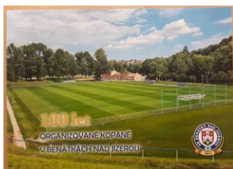
Kniha 100 let