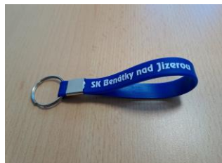
Prívěsek na klíče